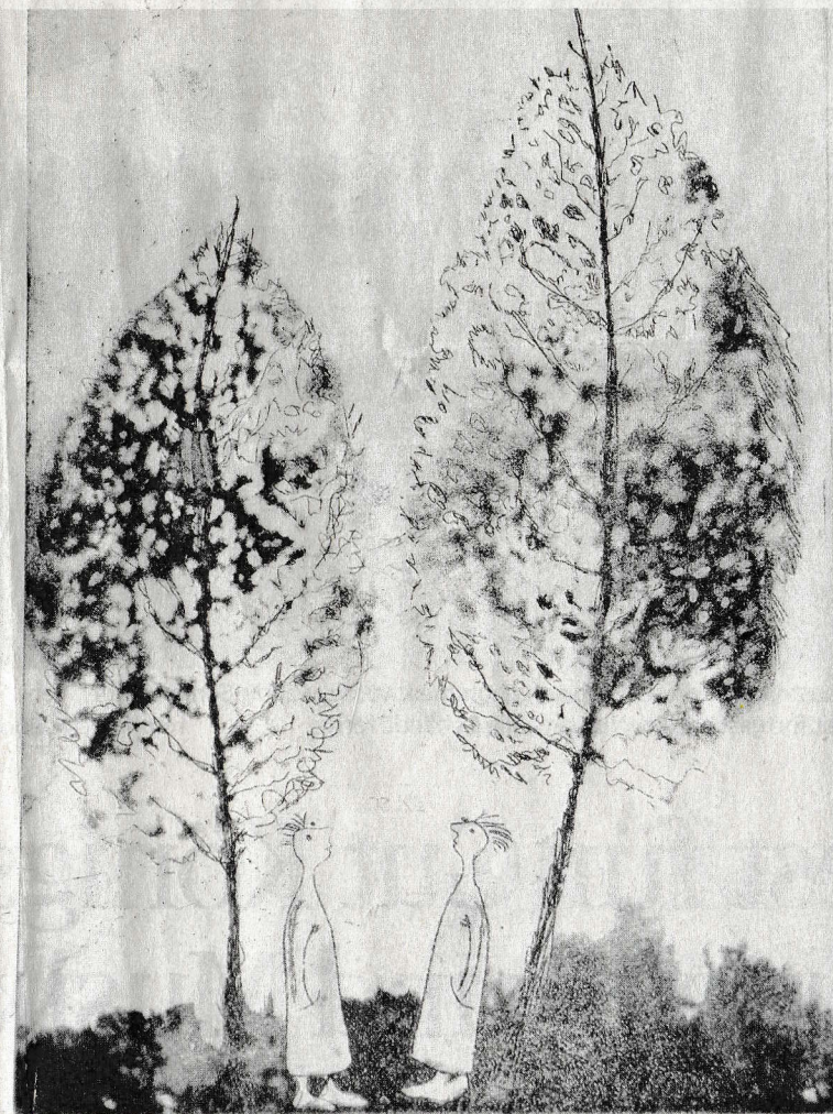
Ein weiteres Werk der Künstlerin Eva-Maria Kohl.